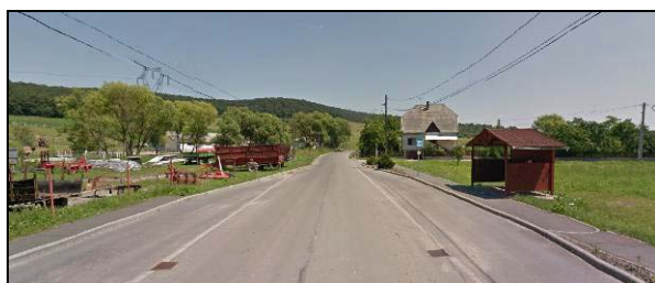
25129. sz. bekötőút