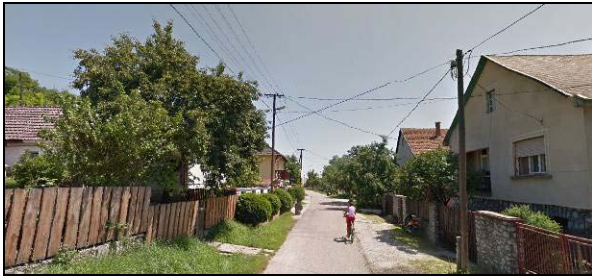
Dózsa György utca