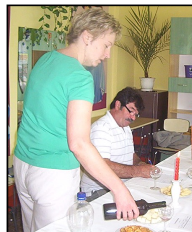
A képek a tavalyi borversenyen készültek