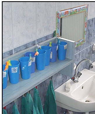
A felűjított mosdó

Az Alacscai Hír k mindenki . Akinek vannak gondolatai, megl t sai, bizonyos dolgokr l, mi sz vesen vesszűk. N vvel, vagy amennyiben, senkire nincsen s rtő hat ssal, n v n lkűl is megjelentesjűk az  js g oldal n. Egy r gi, feled sbe merűlt hagyom nyt szeretn nk ezzel feleleveníteni. Az al bb le rt kőszőntőt, ill. megeml kez st is egy szem lyazonoss g t felfedni nem akaró olvas nkt l kaptuk. Mivel aktu lis, kedves, sz p gondolatok, ez rt olvass k szeretettel.