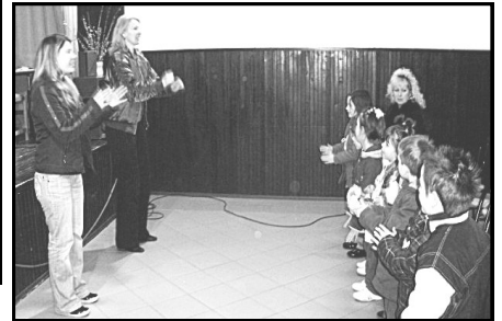
A fotók húsvéti játszóházban, a nyuszi bulin és a bábelőadáson készültek