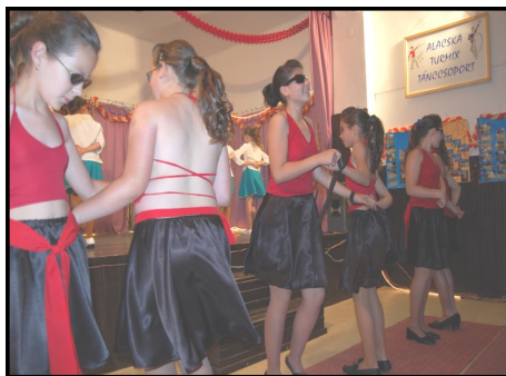
Pillanatképek a Turmix táncsoport előadásai-ból