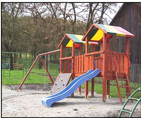
A Meser t Alapítványtól kapott kerti j t k